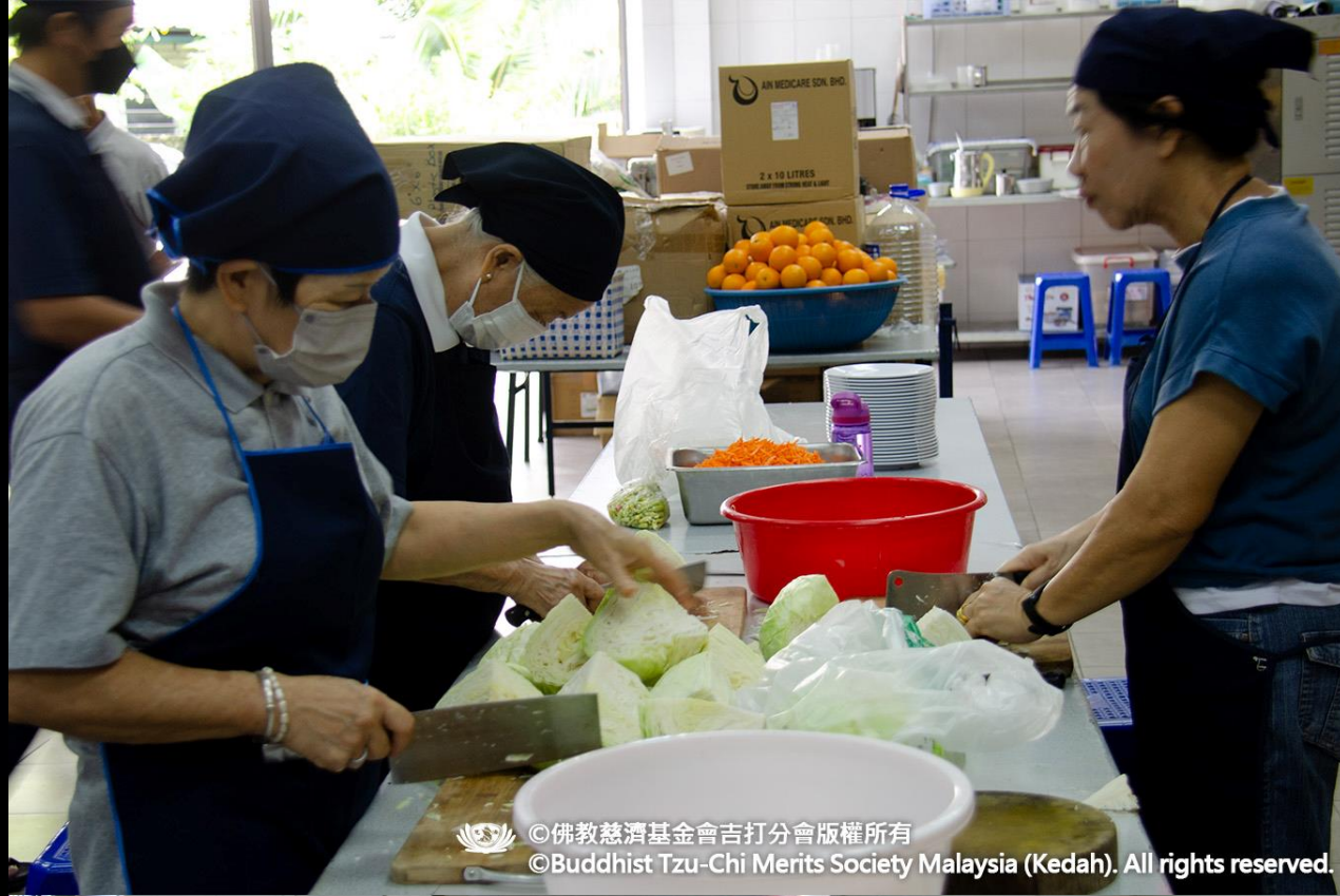
©佛教慈濟基金會吉打分會版權所有 ©Buddhist Tzu-Chi Merits Society Malaysia (Kedah). All rights reserved.