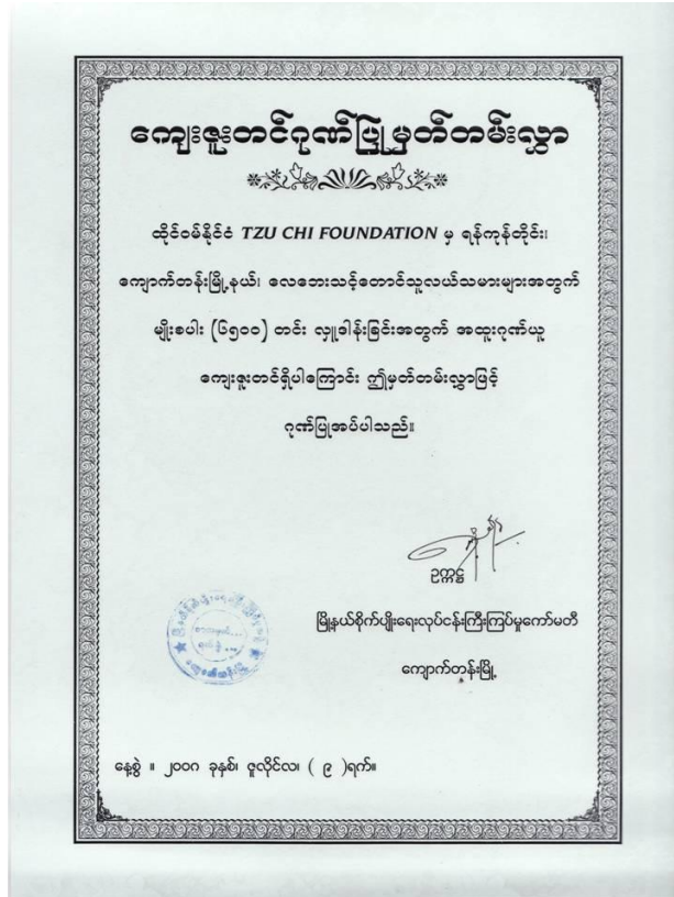
2008年7月9日礁旦農業部主席(Kyauktan Agriculture Committee Chairman)頒發給臺灣慈濟基金會的感謝函。感恩慈濟在礁旦發放6500籮稻種于礁旦受風災的農民。