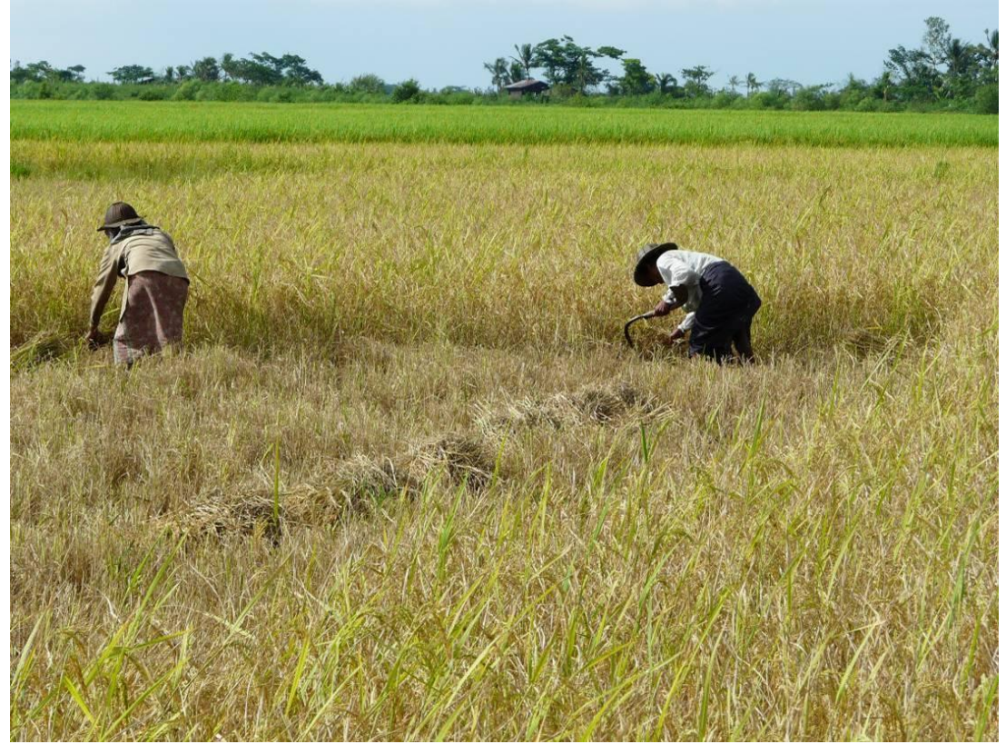
自我盤點莫忘那一年：2008年10月23日 礁旦烏櫻村在 烏櫻村 已經可以看到部分稻田正在收割