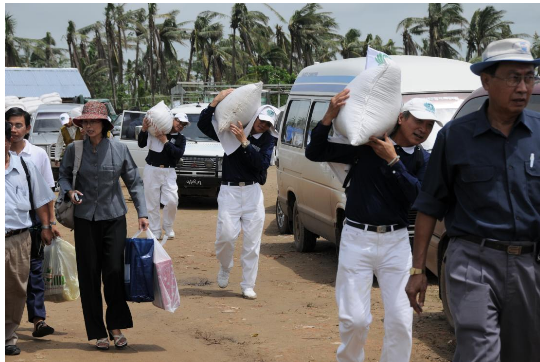
自我盤點莫忘那一年：2008年7月5日 2008年7月5日坤仰貢福種發放啟動