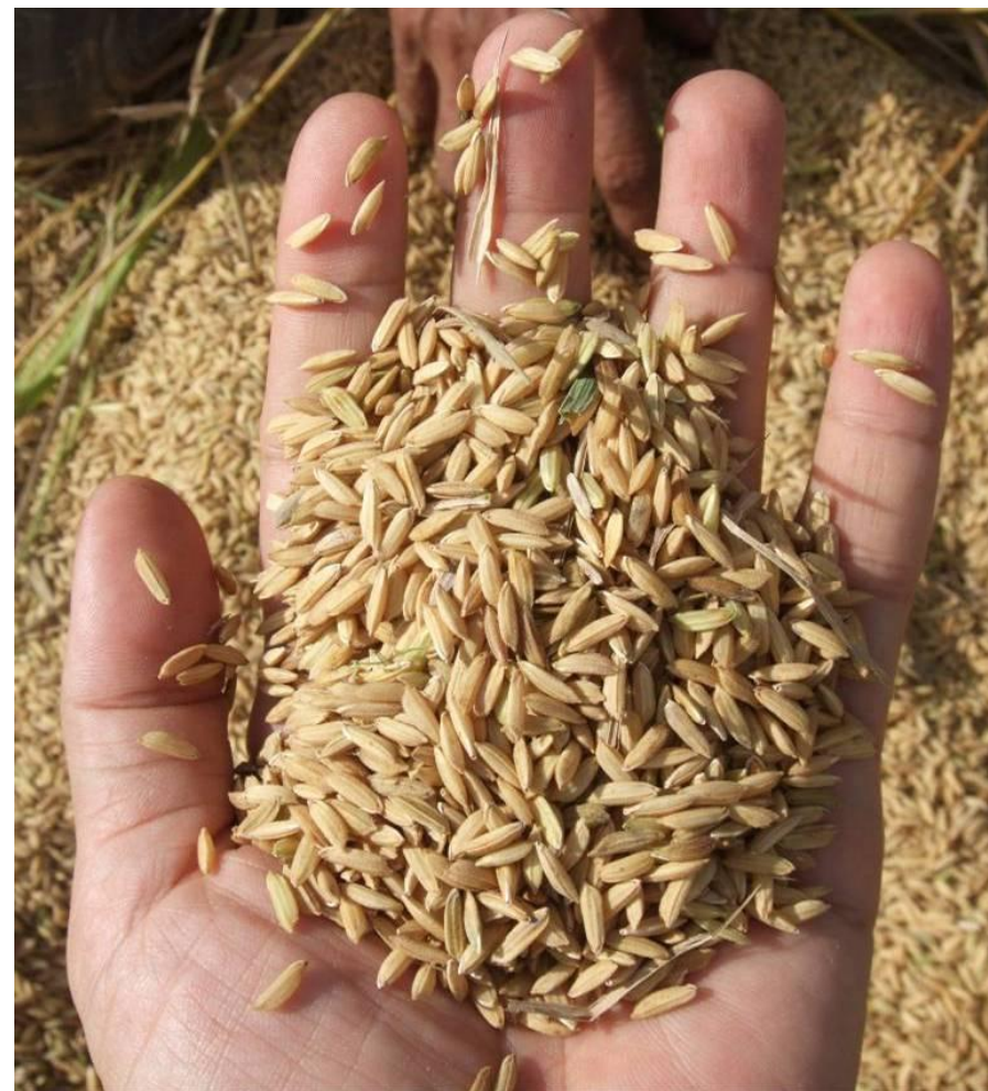
自我盤點莫忘那一年：2008年10月23日 礁旦烏櫻村農民耕種的是一百二十天的可收成的品種「美諾圖卡」