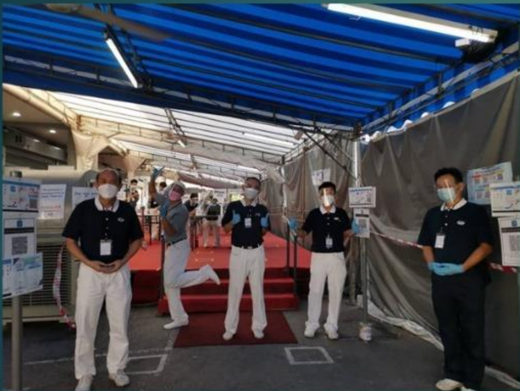
Station 1~ C1