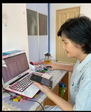
幕後的大功臣 CALL TEAM