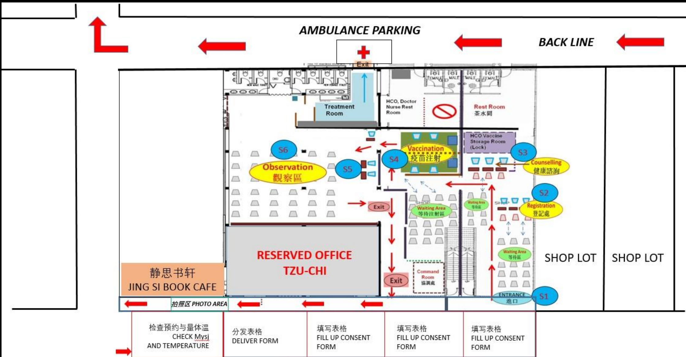
TZU-CHI PPV FLOOR PLAN