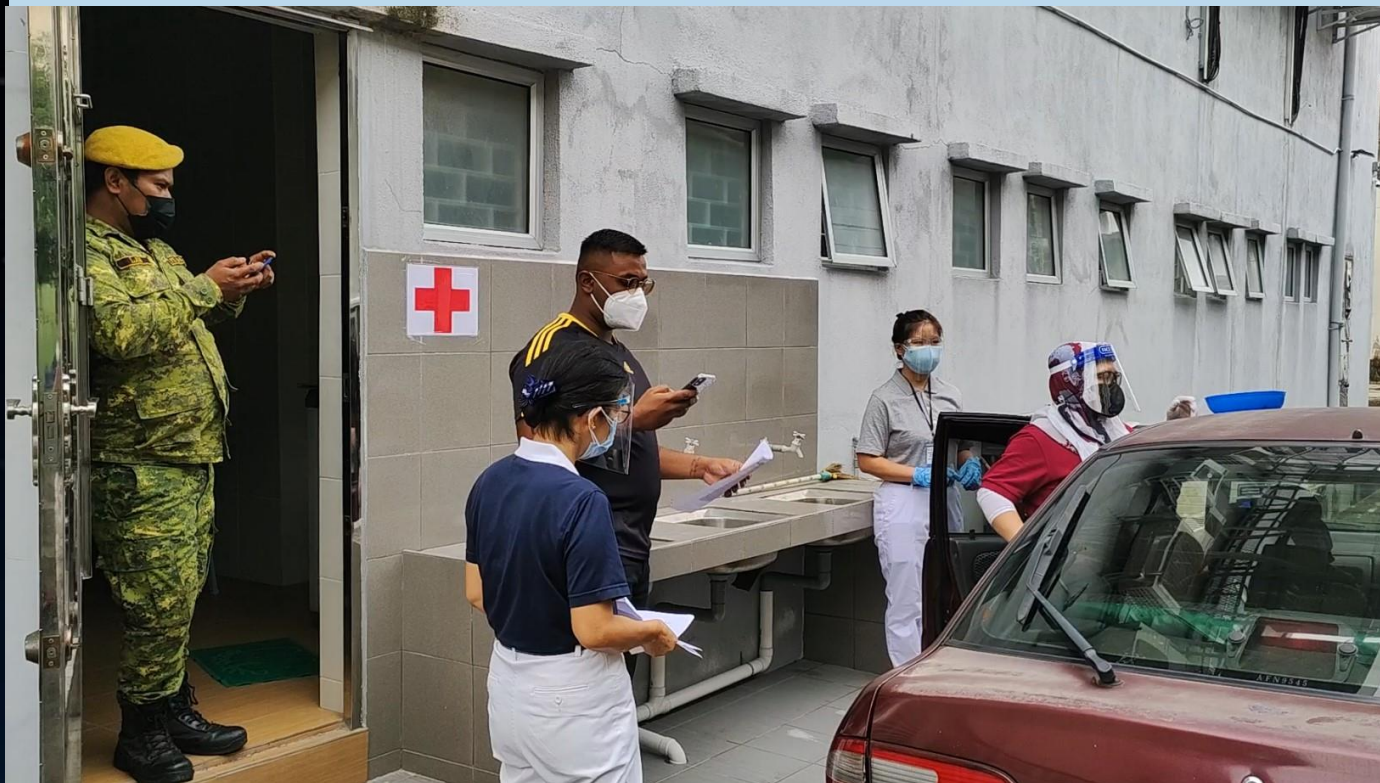
照片為慈濟會所後巷

安報'的查增 排,或狀每加 到,況沉人人 指,黃,手手 定,就立要有M入 位,刻有y口 置,就立有S處 接,刻有S 種,刻有j 。通紅j儉