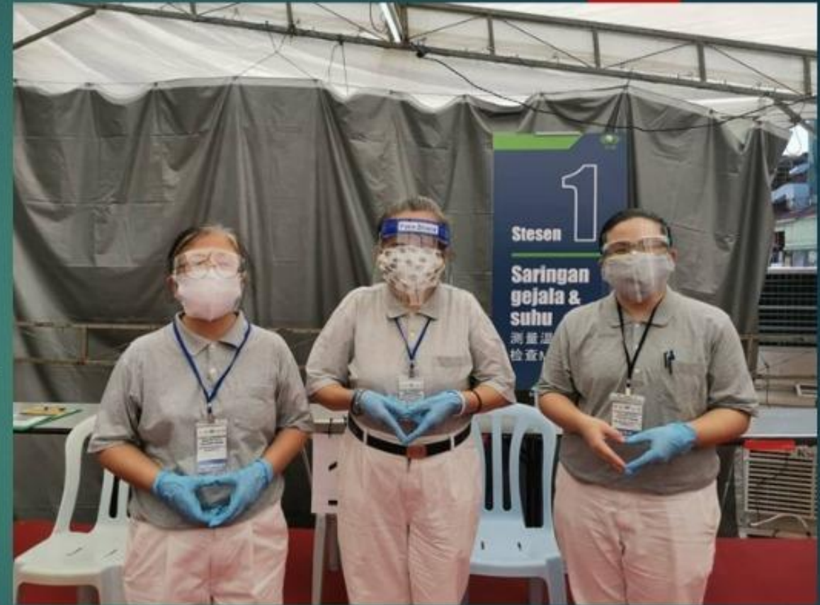
Station 1~ C4