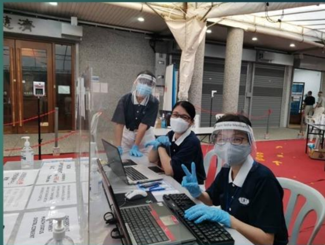
Station 1~ C2