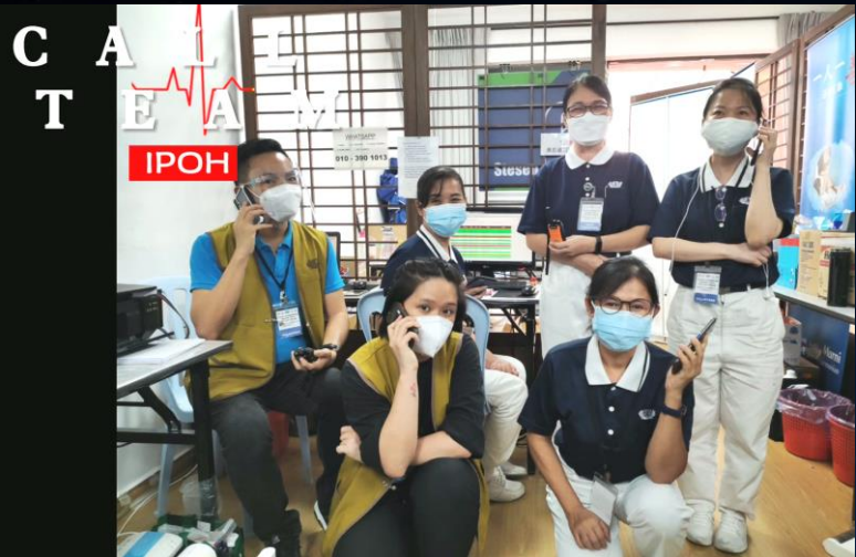
外圍的慈濟人雖不方便到來，但都把握在幕後付出

慈濟人，希望大眾都能 100%的出席，我們特設 一組為Caili Team。 來接種的大眾，都一定會收 到慈濟人的電話， 知道Caili Team 還會溫馨叮嚀大眾記得吃了 早餐才來，身份證一定要帶 最重要的人本身有否確症或 家裏是否有人被隔離等等。