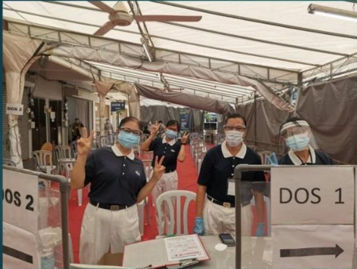
Station 1~ C3