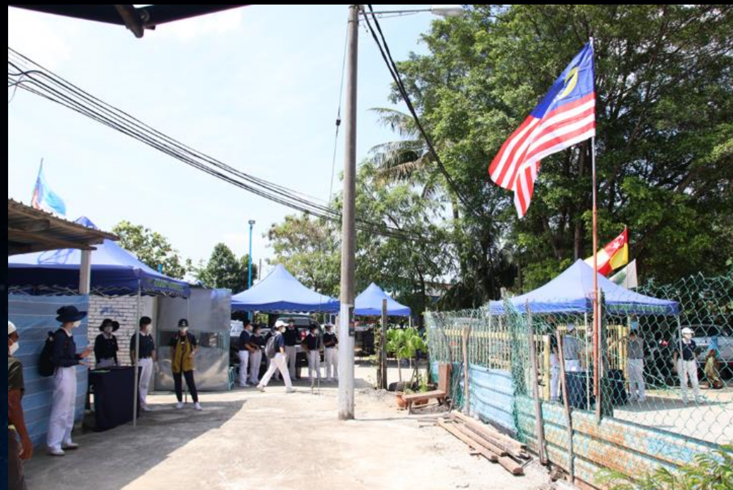
梳邦馬來村汽車廠