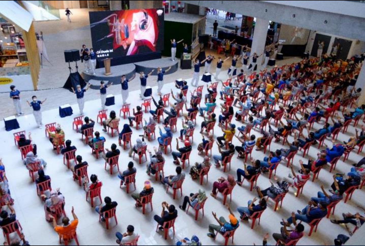
第一城市購物中心