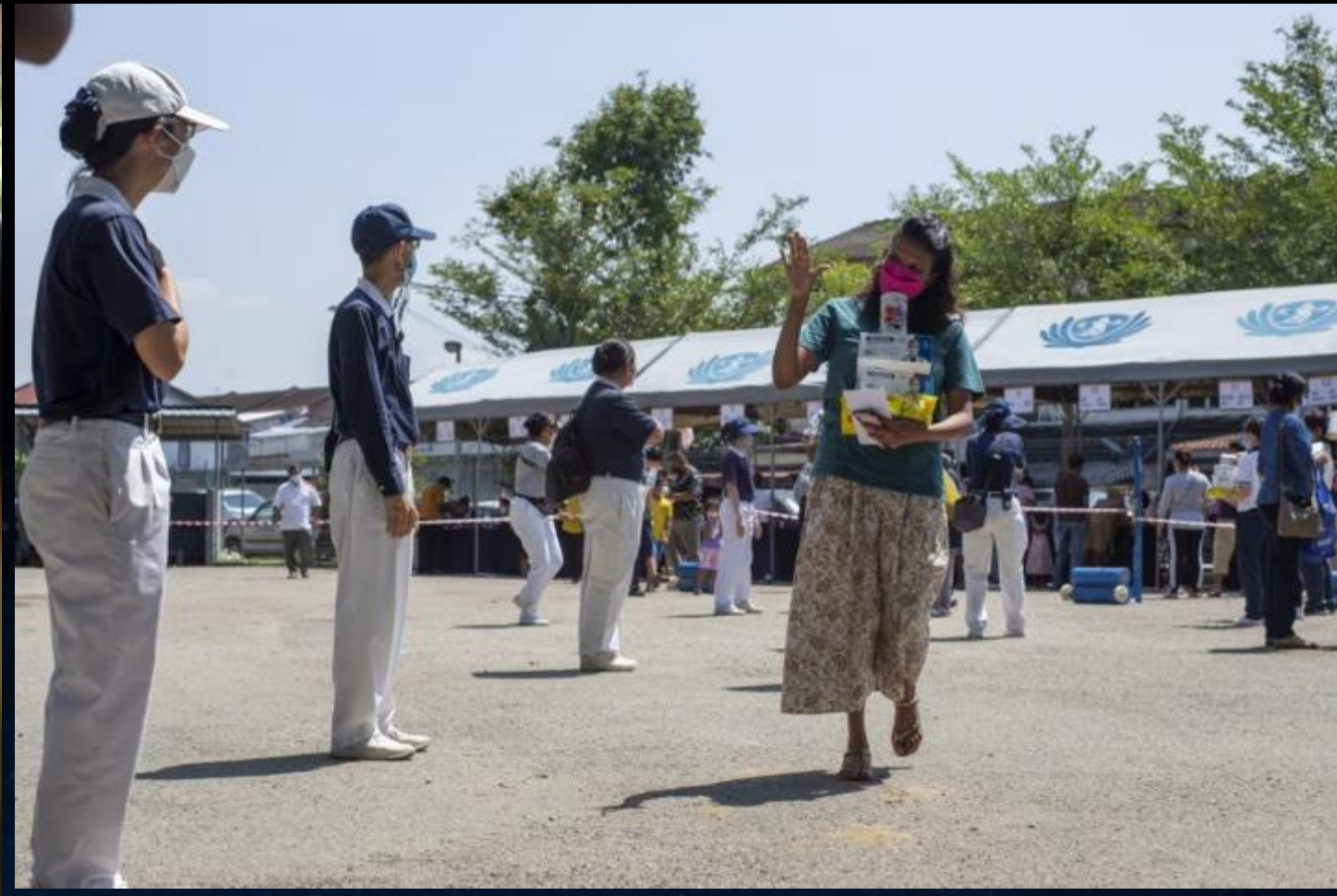
第一城市購物中心