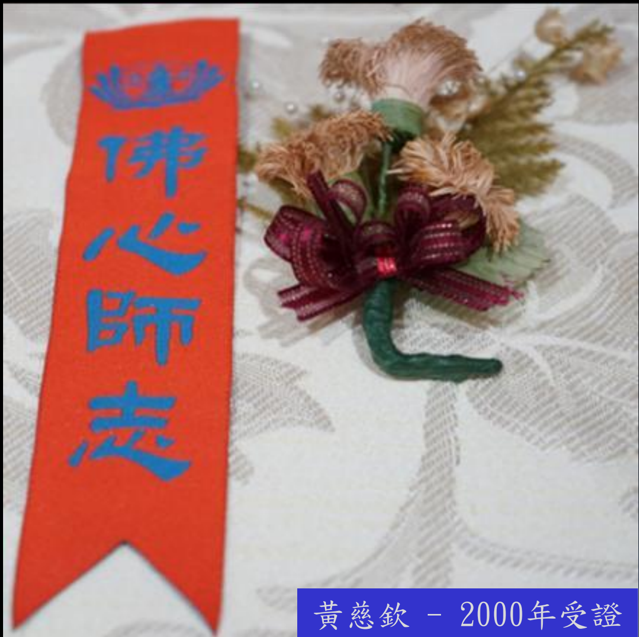
黃慈欽 - 2000年受證