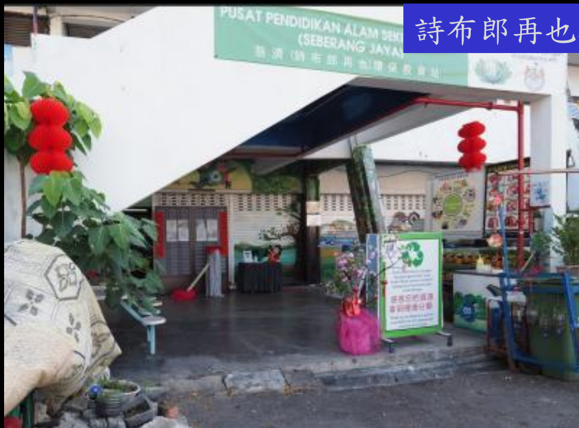
詩布郎再也環保站連線場地