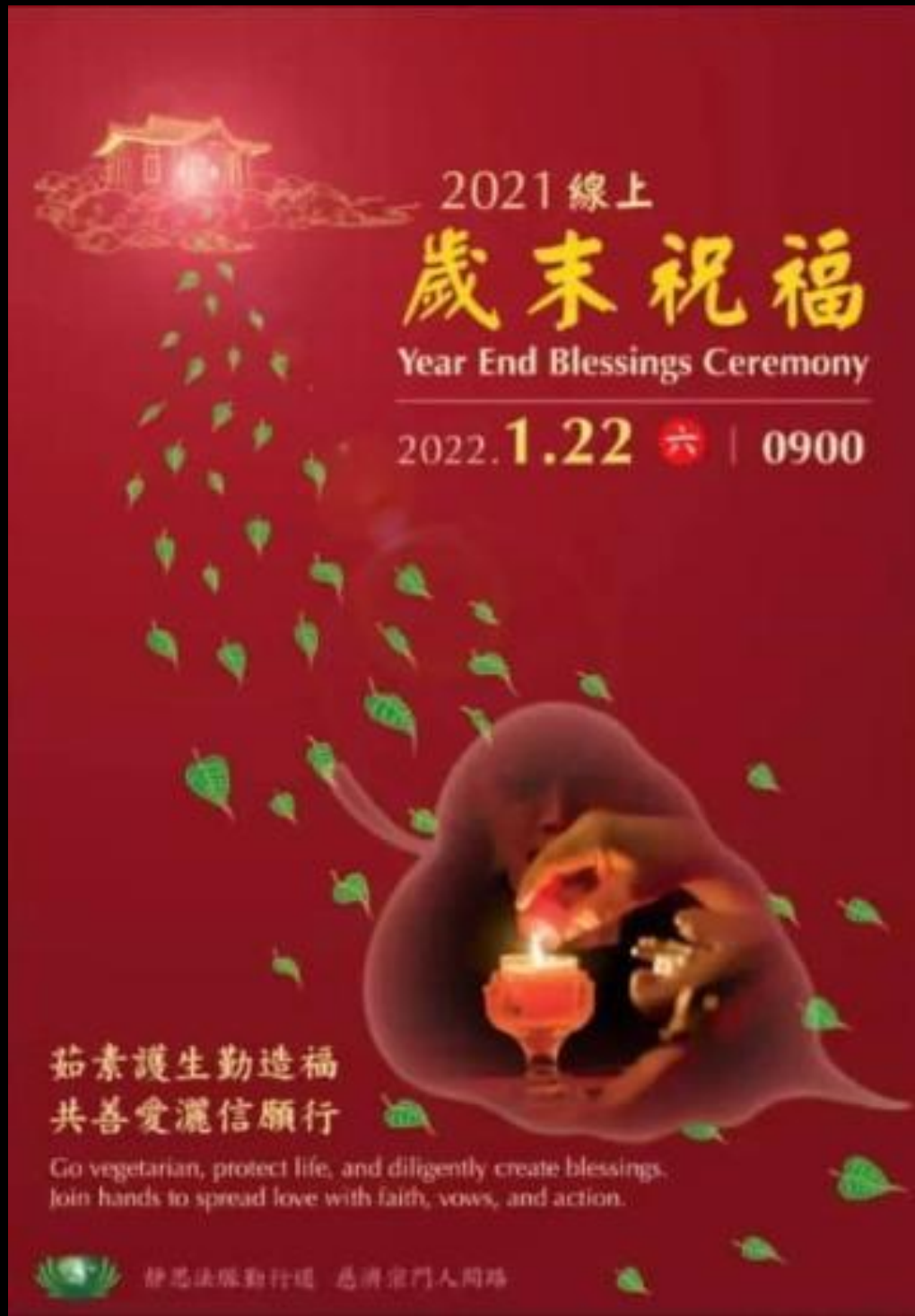
海報：馬來西亞分會提供

時間飛逝，又是新 的一年，盤點生命 價值。用感恩心， 送走過去；用虔誠 心，迎接未來。