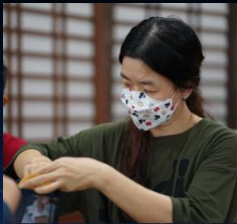
攝影者：王明麗（慮菁）