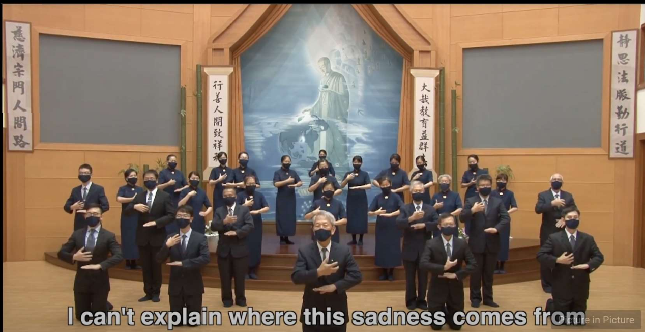
I can't explain where this sadness comes from