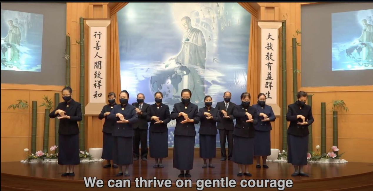
We can thrive on gentle courage