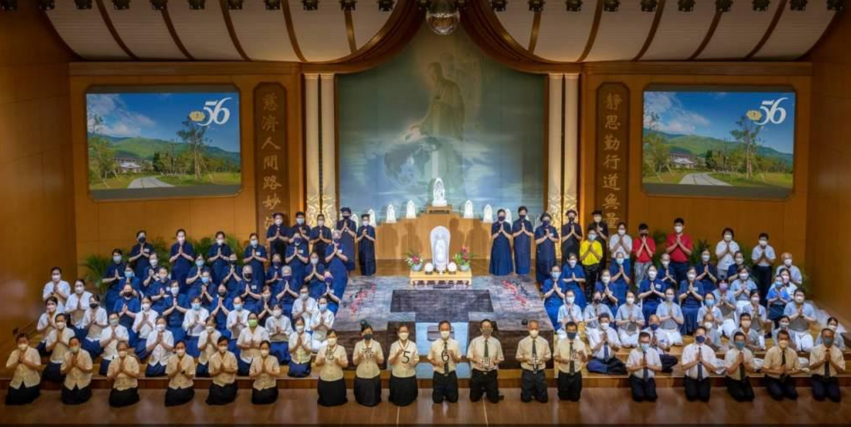
2022年4月24日 | 慈濟56週年慶