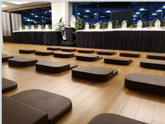
2019.5.9 三節合一