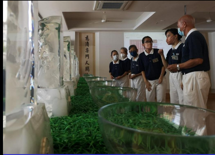
2022年5月14日 為聯絡處全面開放籌備