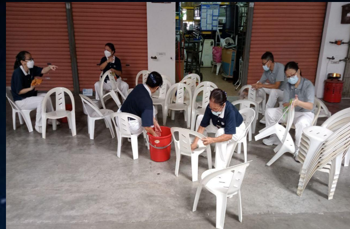
2022年 4月17日及4月23日 幹部打掃聯絡處