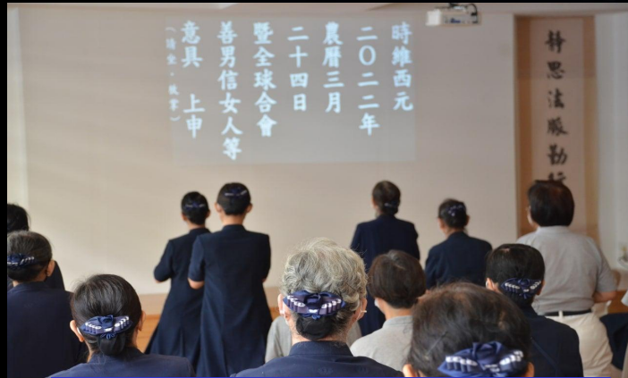
2022年4月24日 禮拜藥師經對內開放