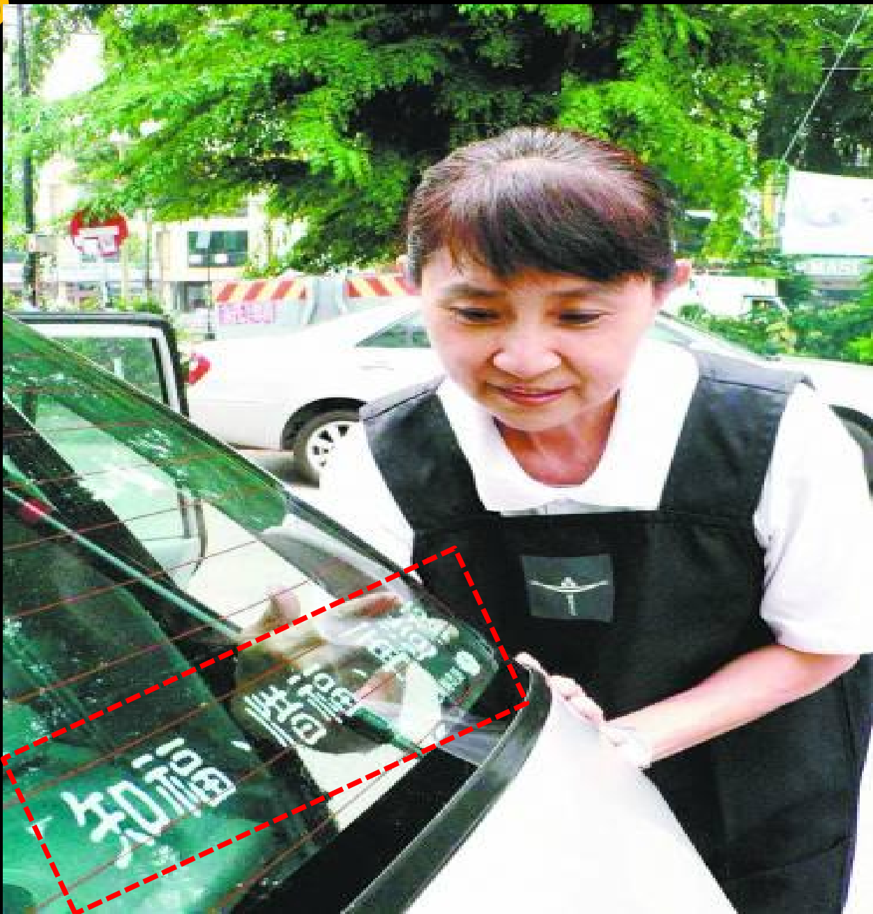
靜思語透明貼紙，可貼在車窗或者玻璃門等。 2009年推廣靜思語檔案

● 又因疫情的關係，為了防禦將禮佛足後手沾香湯的動作後轉為『接法香』，接領靜思語透明貼紙的動作。