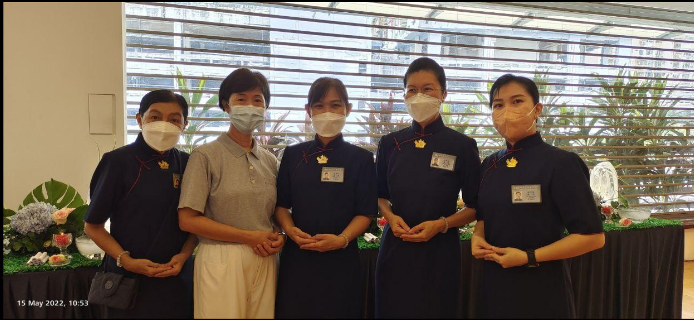
15 May 2022, 10:53