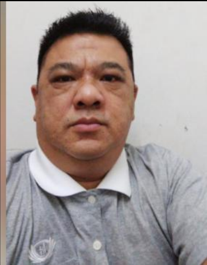
分享者：吳金城

因為睡眠呼吸中止症， 晚上睡覺時會經常停止 呼吸。呼吸對我很重要 ，每次睡醒時，我很感 恩還可以醒過來。