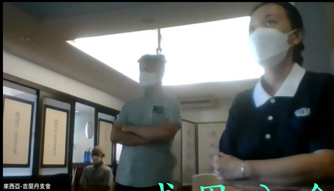
來西亞-吉蘭丹支會