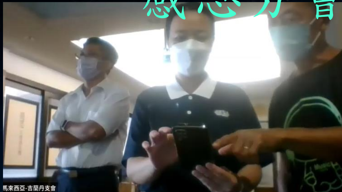
馬來西亞-吉蘭丹支會