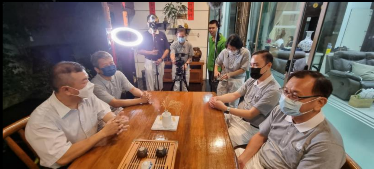
日期：2022年8月6日，地點：實達熱帶 (Setia Tropika)