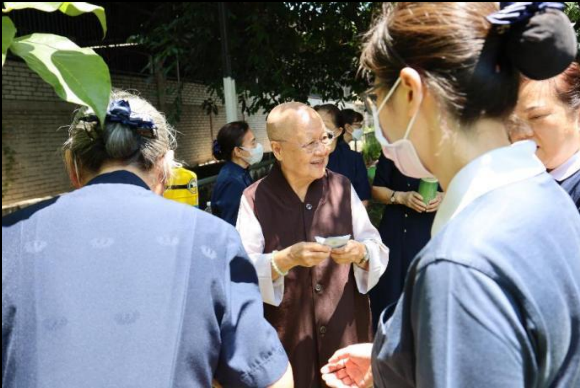
攝影者：林俊業（本旭）