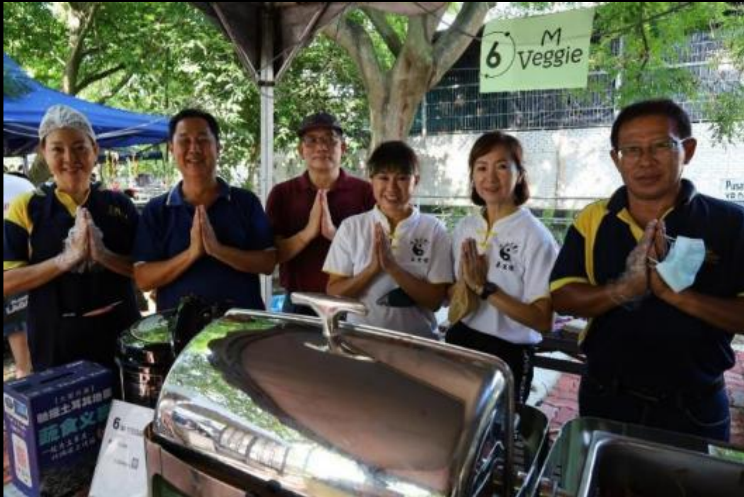
齊心閣素食餐館股東們一起護持無肉市集2.0