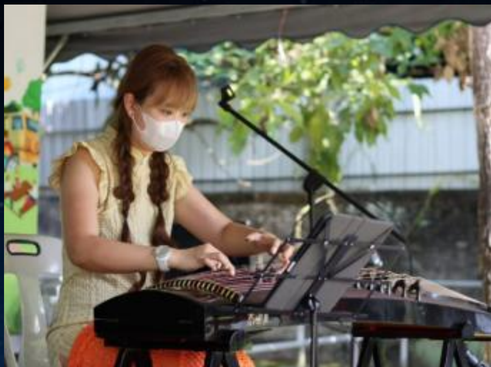
攝影者：羅莉玲（明佃）