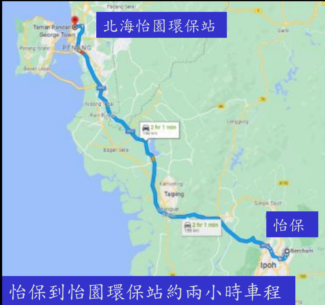
怡保到怡園環保站約兩小時車程