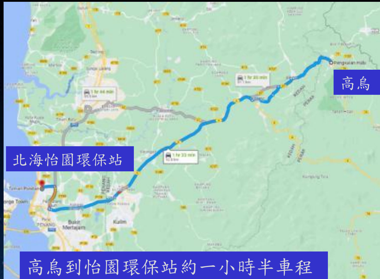
高烏到怡園環保站約一小時半車程