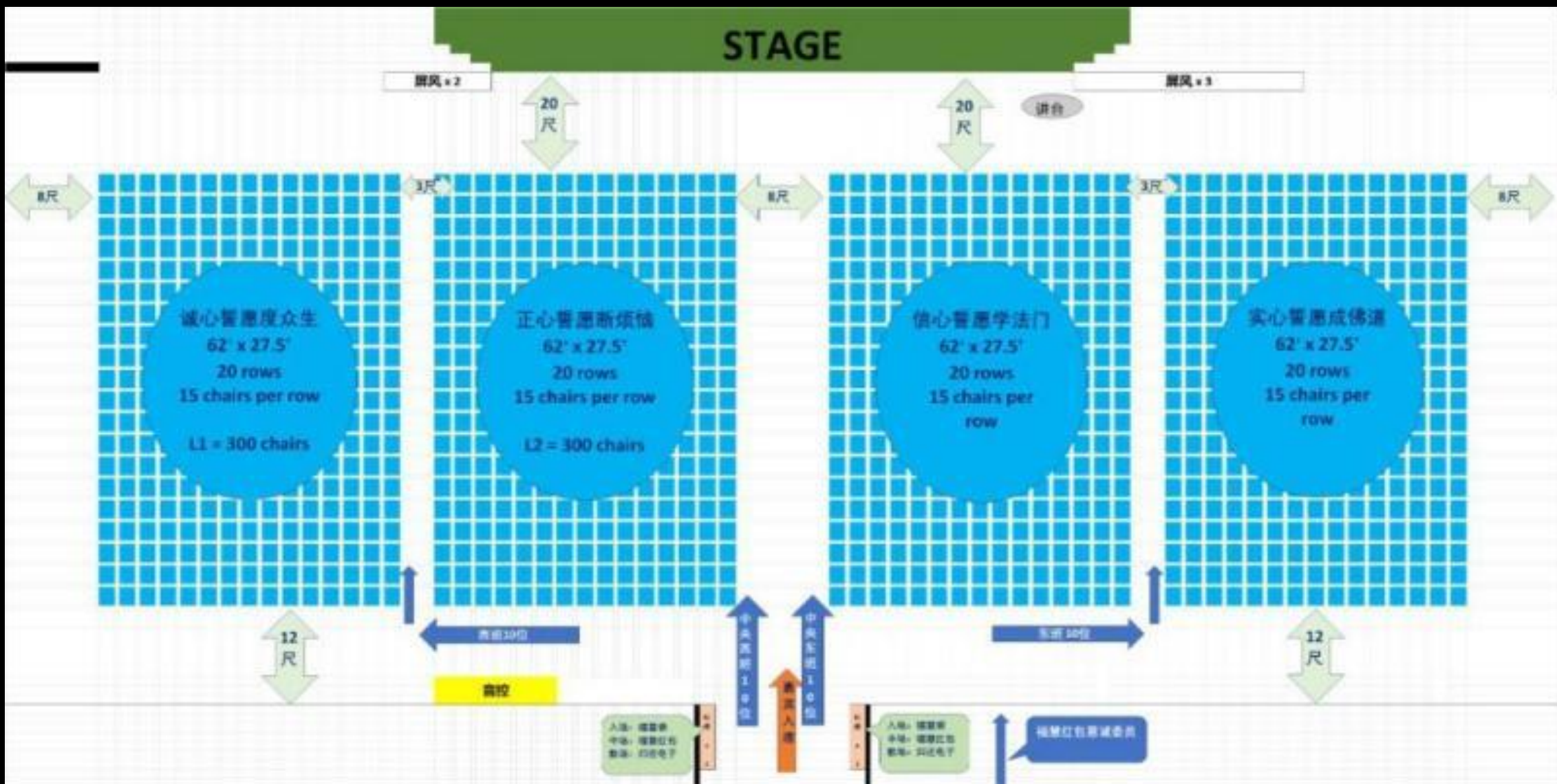
內場設計：江福泉(惟佳)