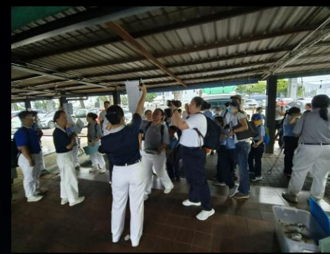
# 分組及領取任務卡機器具