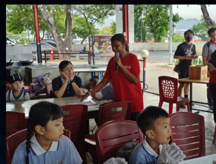
# CEMACS 人員主持開幕