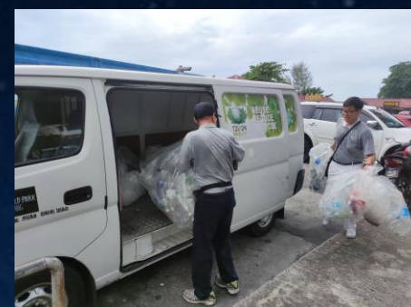
# 慈濟環保站載送可回收物