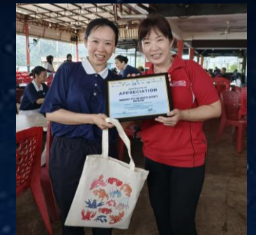
# 頒發感謝證書與閉幕典禮