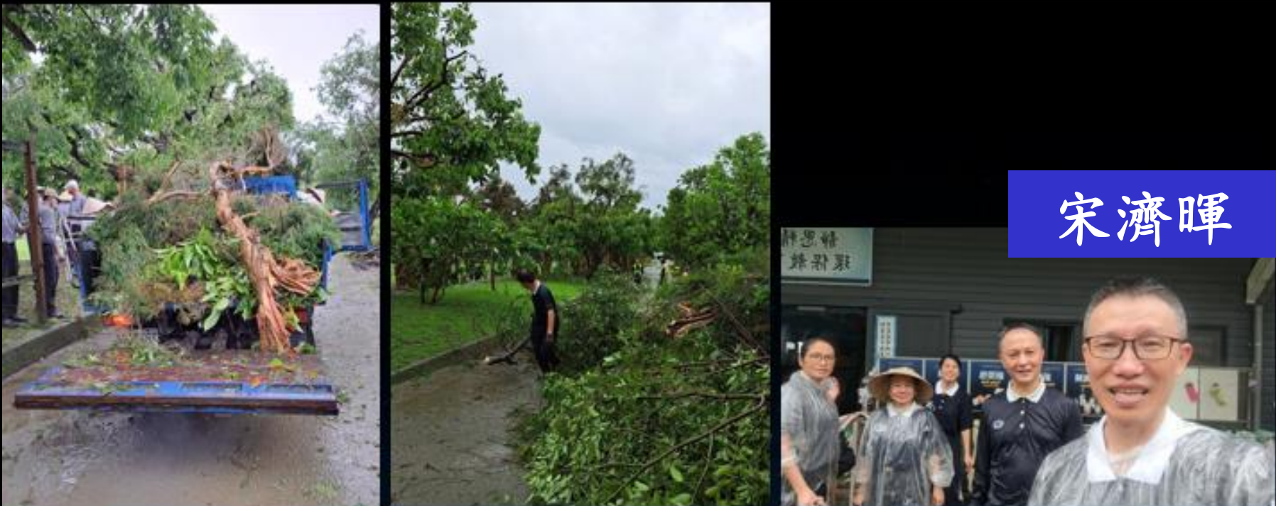
因颱風樹倒，2024年7月27日早上精舍整理環境大動員。

不怕颱風，不怕地震，還會一再回來，菩薩要投入人間道，人間本來就是這樣，四大地水火風。 (2024年10月6日開示)