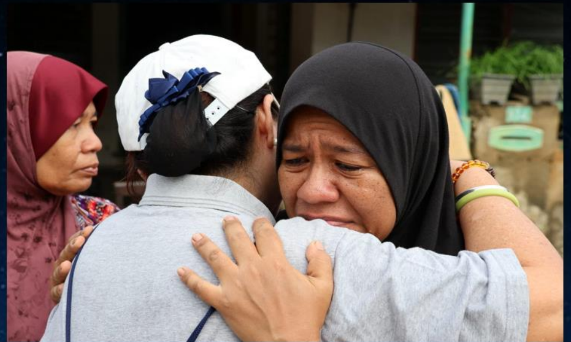
攝影者：截自簡報畫面