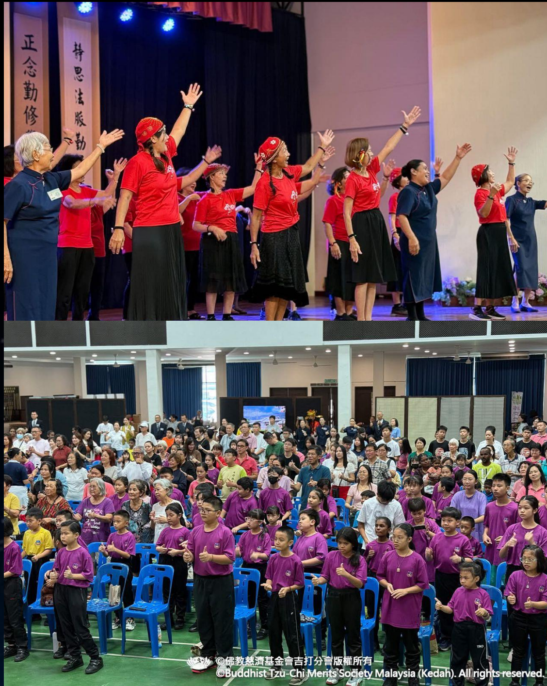
©佛教慈濟基金會吉打分會版權所有 ©Buddhist Tzu-Chi Merits Society Malaysia (Kedah). All rights reserved.