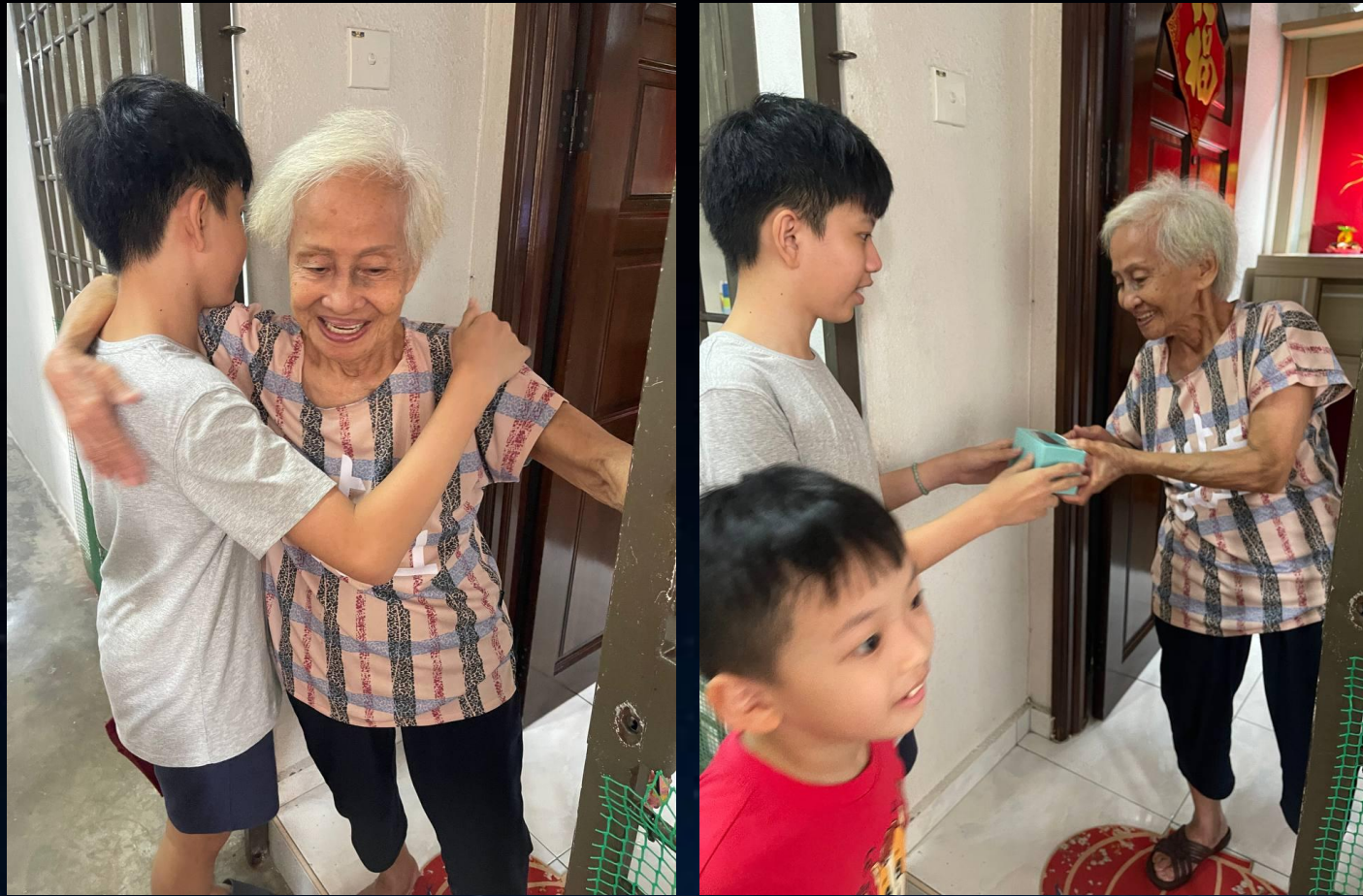
拍攝者：峇六拜家長